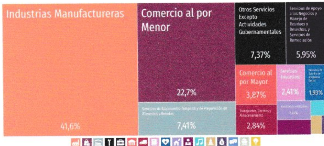
Empleados dependientes de la unidad económica según sector económico en 2019

Según datos del Censo Económico 2019, los sectores económicos que concentraron más empleados dependientes de la unidad económica en Tizayuca fueron Industrias Manufactureras (10,649 empleados), Comercio al por Menor (5,805 empleados) y Servicios de Alojamiento Temporal y de Preparación de Alimentos y Bebidas (1,896 empleados).