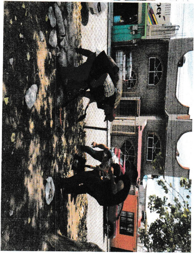
Ilustración 2. Se observan raíces expuestas.