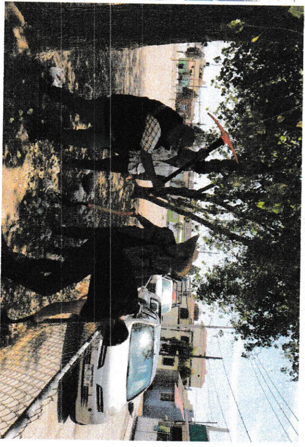
Ilustración 4. Se podarán las raíces de los demás árboles.