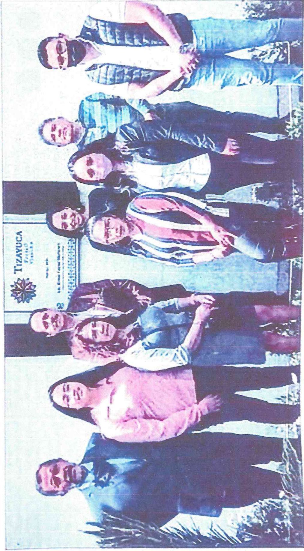
Develan placa de Pueblo con Sabor en Tizayuca