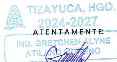
ING. GRETCHEN ALYNE ATILANO MORENO PRESIDENTA MUNICIPAL CONSTITUCIONAL DE TIZAYUCA, HIDALGO.

EL ACTO DE FALLO SE LLEVARÁ A CABO EL DÍA 11 DE ABRIL DE 2025 A LAS 16:00 HORAS EN LA SALA DE JUNTAS DE LA SECRETARÍA DE HACIENDA Y ADMINISTRACIÓN, UBICADA EN EL SEGUNDO PISO DE LA CIUDAD ADMINISTRATIVA CALLE ALLENDE S/N, COLONIA CENTRO, MUNICIPIO DE TIZAYUCA, ESTADO DE HIDALGO. C.P 43800.