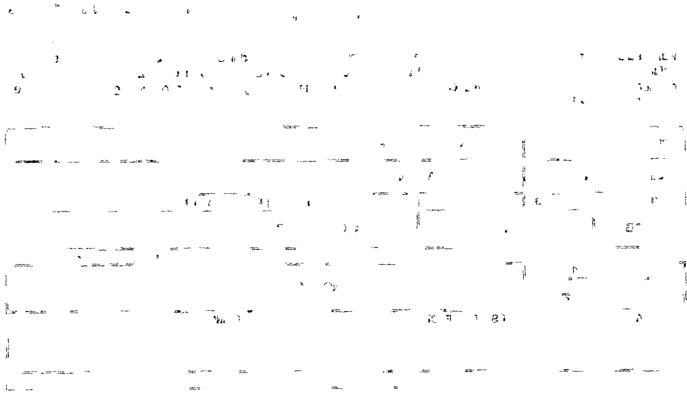
PLATE 10 OF 100